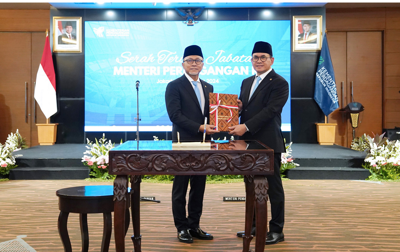
Serah Terima Jabatan Menteri Perdagangan.

Mendag Budi juga menyampaikan apresiasi kepada Menteri Koordinator Bidang Pangan, Zulkifli Hasan atas capaian Kementerian Perdagangan pada masa kepemimpinannya periode 2022-2024, serta atas arahan dan bimbingannya.