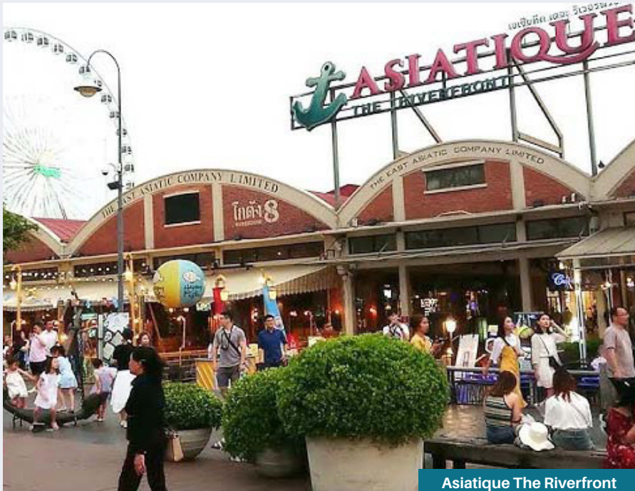
Asiatique The Riverfront

toko pernik-perniknya hingga berburu makanan halal kaki lima.