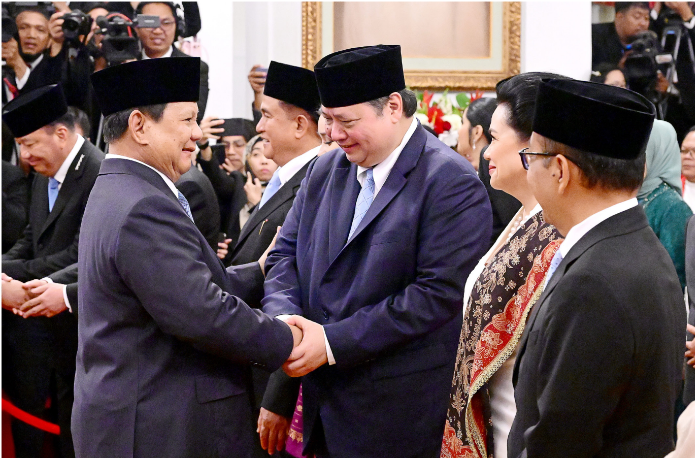
Airlangga Hartarto dan Presiden Prabowo Subianto.