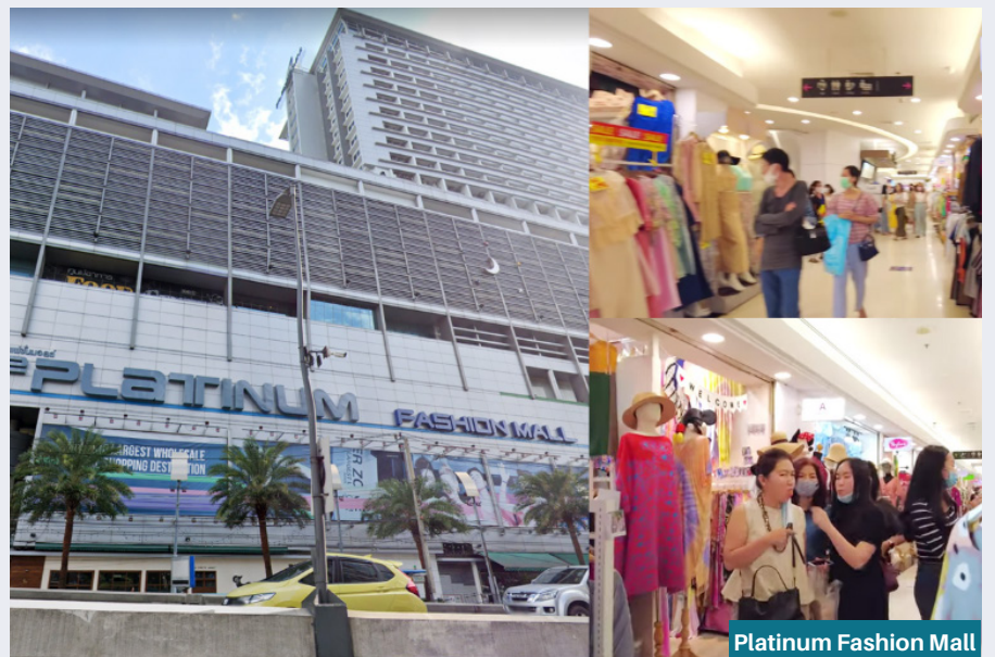
Platinum Fashion Mall

Asiatique ini merupakan destinasi wisata yang ramah Muslim di Bangkok yang cocok dikunjungi pada sore menjelang malam hari. Para pengunjung bisa menjelajahi keindahan perkotaan. Tak hanya itu, pengunjung juga bisa berkunjung ke