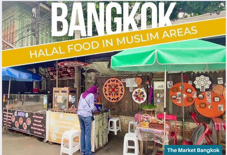
The Market Bangkok

Dari Masjid ini, para pengunjung bisa menelusuri jejak tersebarnya agama Islam di masjid tersebut. Jawa Mosque didirikan oleh keturunan dari pendiri Muhammadiyah di tanah air. Tepatnya cucu dari K.H. Ahmad Dahlan yang bernama Wilai Dahl-