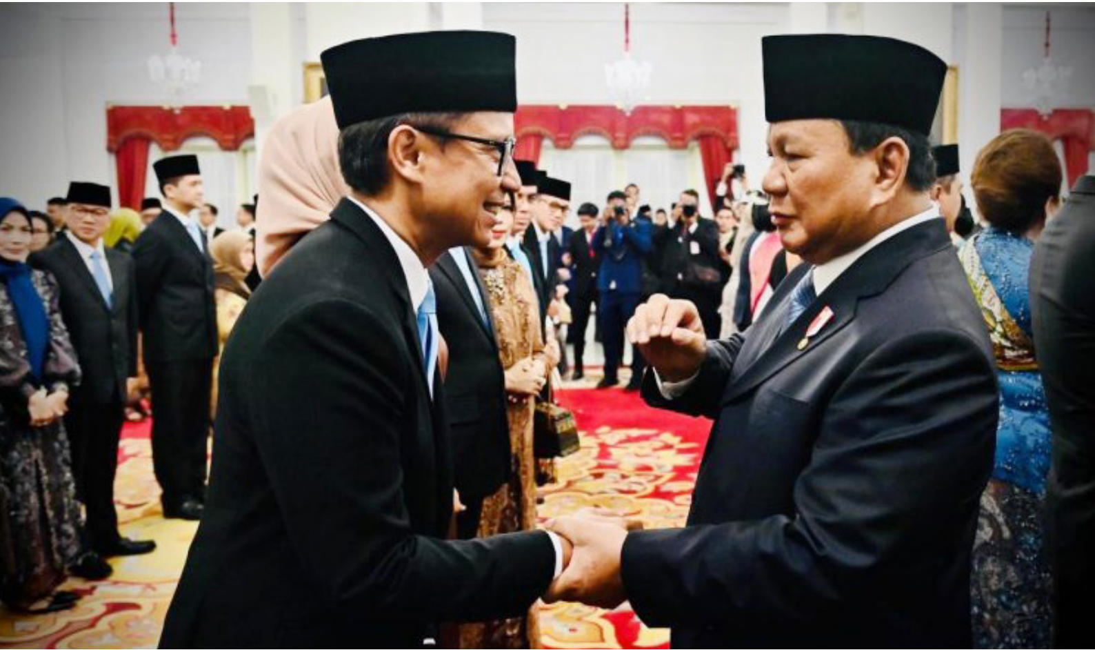
Budi Gunadi Kembali jadi Menteri Kesehatan.