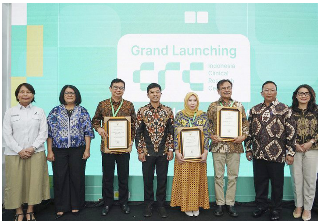
Kemenkes Luncurkan One Stop.

Dengan kehadiran INA-CRC, diharapkan Indonesia dapat memiliki akses cepat dan efisien terhadap inovasi bioteknologi