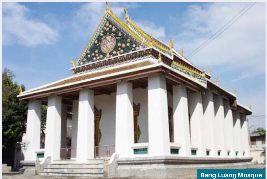
Bang Luang Mosque