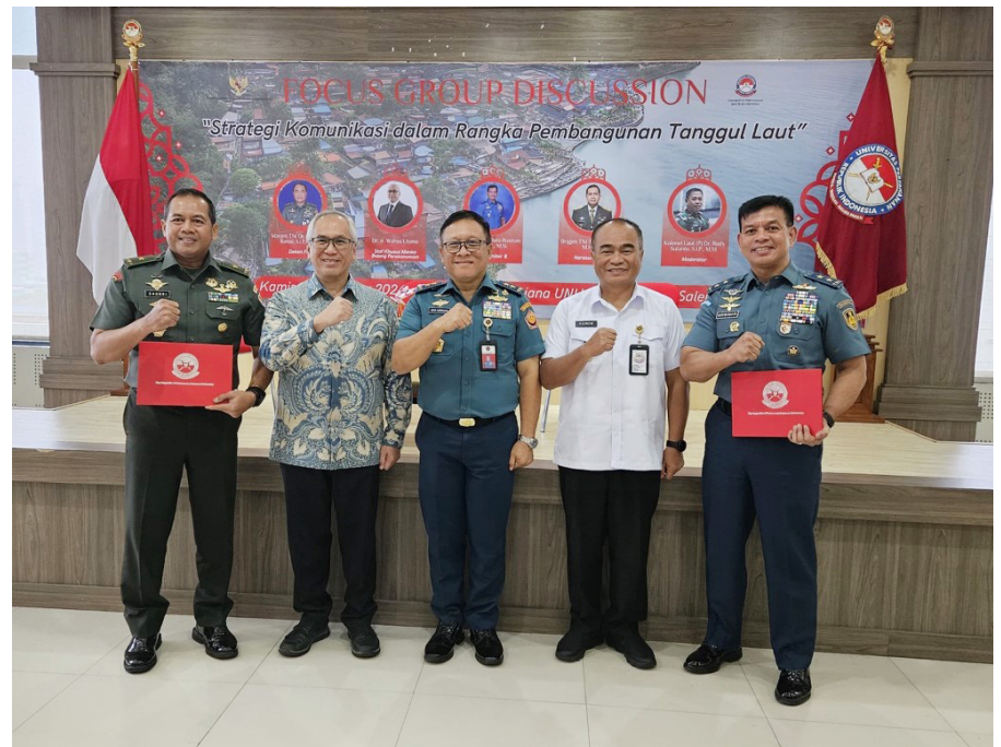
Kemenko Perekonomian Kerja sama Universitas Pertahanan.

Sementara itu, Perwakilan dari Universitas Pertahanan, juga menegaskan terkait pentingnya strategi komunikasi yang efektif dalam proyek pembangunan tanggul laut di Pantura Jawa, guna memastika-