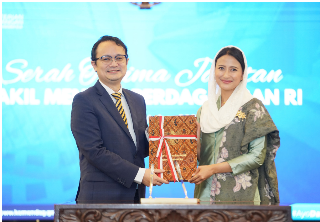
Serah Terima Jabatan Wakil Menteri Perdagangan.