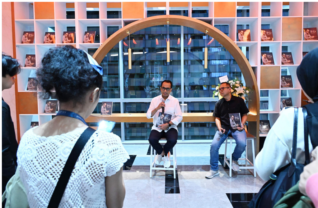
Menhub Sebut 3 Capaian Terbaiknya.

"Jakarta sebagai pelopor sudah melakukan banyak hal. Hampir 30% masyarakat Jakarta pakai angkutan massal. Yang membahagiakan, pemda-pemda terpacu melakukan ini. Sayang fiskalnya belum mungkin. Mudah-mudahan angkutan modern seperti di Jakarta, semakin banyak dibuat di tempat lain," ungkap Menhub.