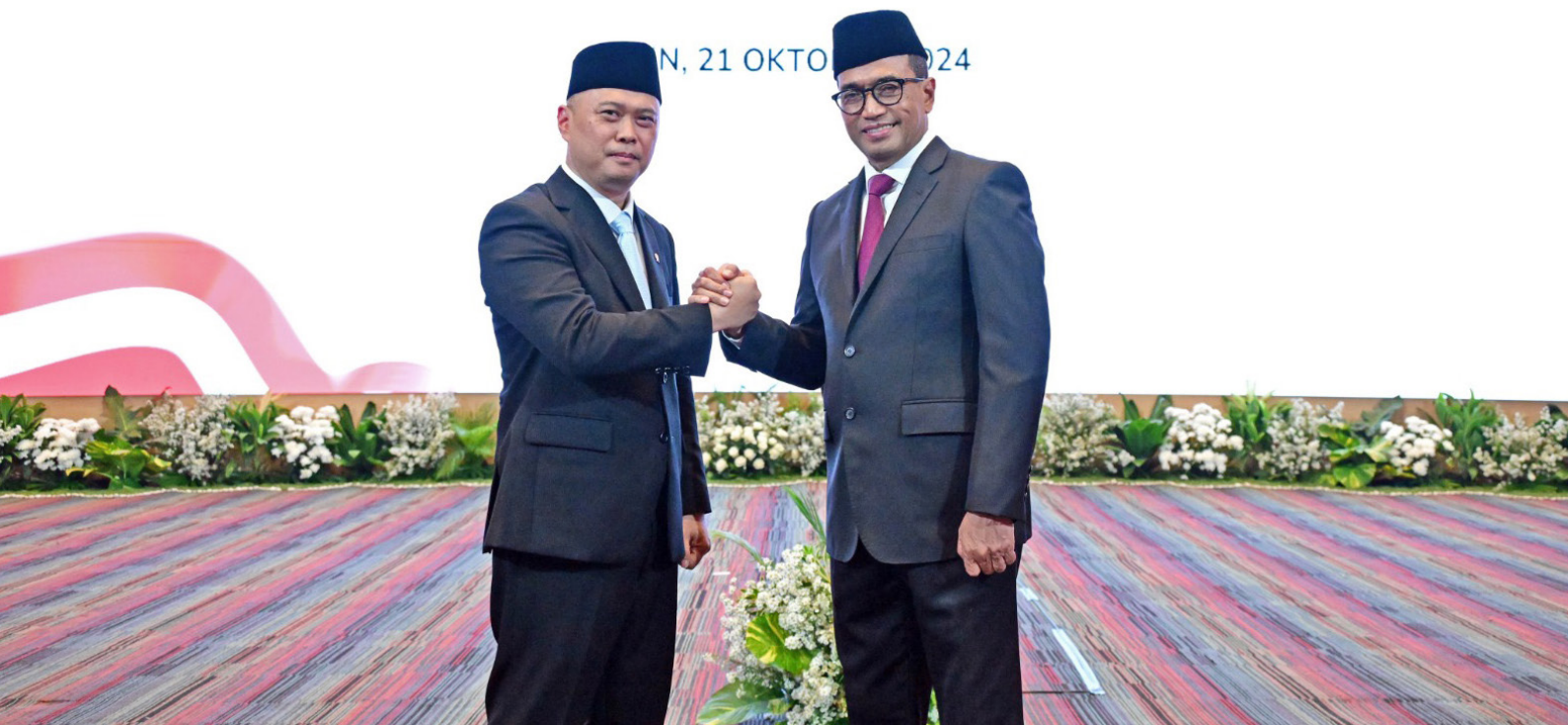
Serah Terima Jabatan Menteri Perhubungan.