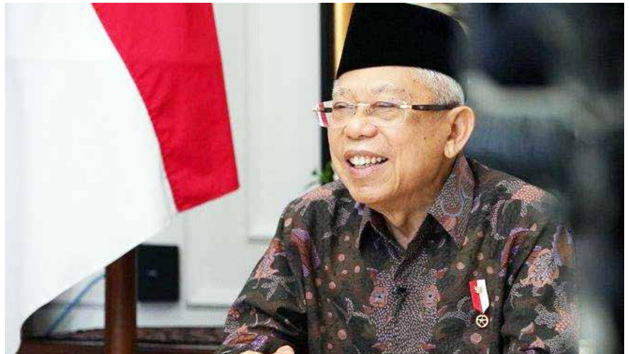
Wakil Presiden Maruf Amin

"Ke depan, KNEKS akan terus berperan sebagai konsolidator dan melaksanakan arrangement ini agar terus terjalin sinergi dengan baik di antara semua pelaku, baik pemerintah, pelaku usaha, kalangan akademisi dan masyarakat lebih luas, dalam