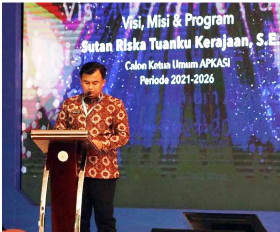
Sutan Riska Tuanku Kerajaan

"Kita masih akan fokus dalam penanganan pandemi Covid-19 yang belum berakhir, dengan memperkuat testing, tracing, dan treatment. Dan yang juga amat penting adalah mempercepat program vaksinasi di seluruh kabupaten di Indonesia," ujarnya.