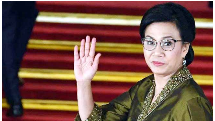
Menteri Keuangan Sri Mulyani

multi pihak ini akan terus berlanjut dan berjalan sesuai dengan harapan kita bersama dan memberikan dampak positif kepada masyarakat, khususnya pelaku UMKM," katanya.