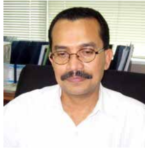
OLEH: DR. MUHAMMAD NAJIB

Bahan-bahan sutra dengan desain Persia, Arab, dan Turki sesuai pesanan dan selera masyarakat Timur Tengah diproduksi secara masif. Bahkan hiasan dinding, kaligrafi, sampai berbagai jenis perleng-