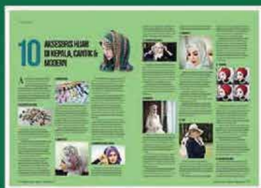
IKLAN CENTER SPREAD FC Rp. 80.000.000