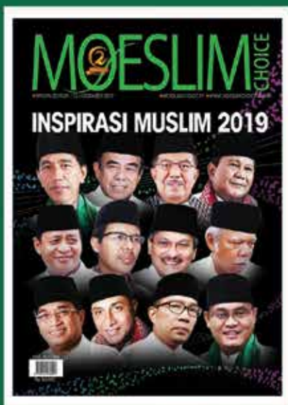
IKLAN 1 HALAMAN FC Rp. 50.000.000