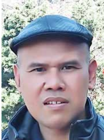
OLEH: TONY ROSYID Pengamat Politik dan Pemerhati Bangsa

Itu baru bicara ormas. Belum lagi bicara