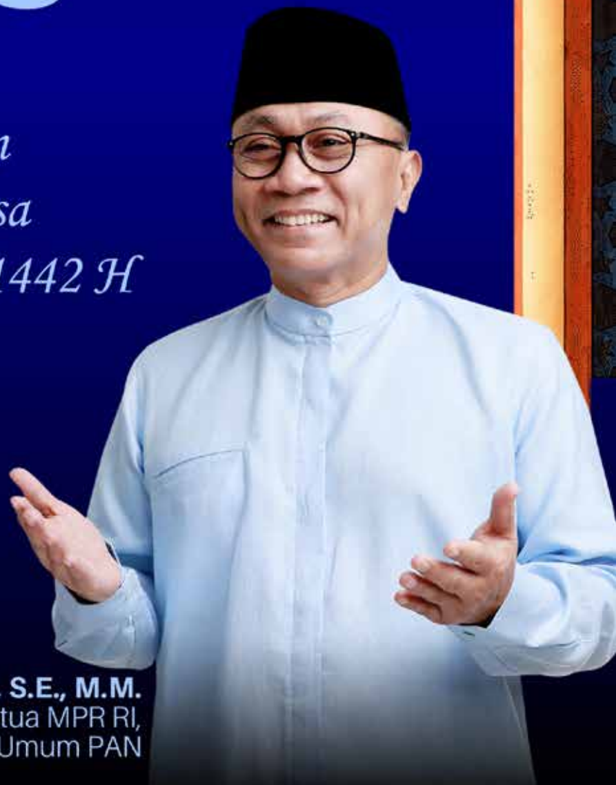
DR. H. ZULKIFLI HASAN, S.E., M.M. Wakil Ketua MPR RI, Ketua Umum PAN

Selamat Menunaikan Ibadah Puasa Ramadhan 1442 H