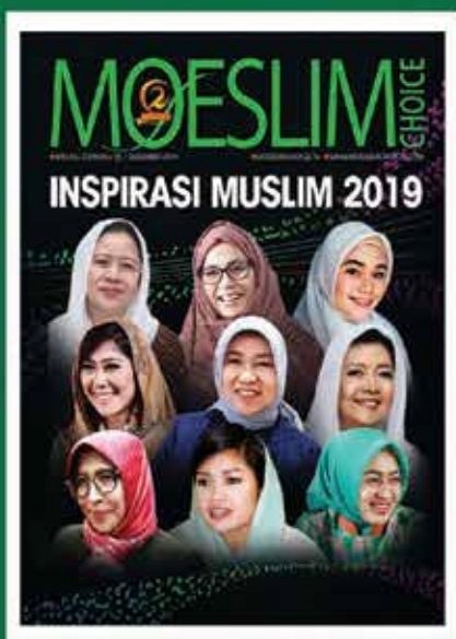
IKLAN BACK COVER FC Rp. 75.000.000